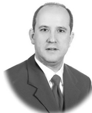
D. Jaime Aurelio Viña Olay Fundamentos de Ciencia de Materiales