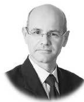
D. Jorge Parrondo Gayo Análisis y Diseño de Instalaciones de Fluidos