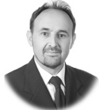
D. Manuel López Aenlle Diseño y Cálculo de Estructuras