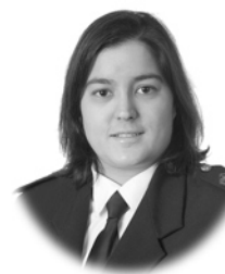
Alba Rodríguez Moreno Construcción Avilés (Asturias)