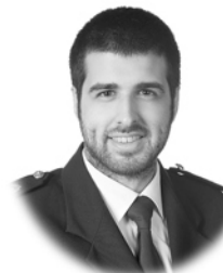
Yago Meilán Iglesias Construcción Lugo (Galicia)