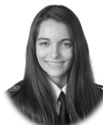
Covadonga Bayón Cueli Construcción Gijón (Asturias)