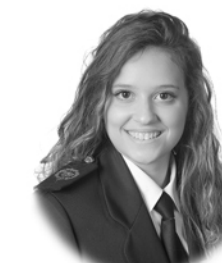
Alba Vila Suárez Electrónica para la Eficiencia Energética Avilés ( Asturias )