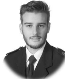
Pelayo de la Fuente Álvarez Electrónica para la Eficiencia Energética Oviedo ( Asturias )