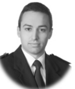
Iván Pérez Artime Construcción Gijón ( Asturias )