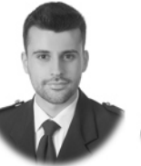
Ignacio Herrero Granda Construcción Oviedo ( Asturias )