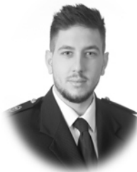
Manuel Cuenca Arconada Electrónica para la Eficiencia Energética Gijón (Asturias)