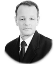
D. Sergey Shmarev Jiguleva Cálculo