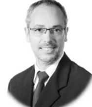
D. Santiago Martín González Expresión Gráfica