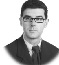
D. Diego Álvarez Prieto Sistemas de Control